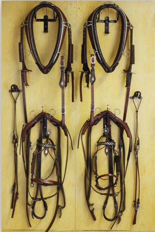
Braunes Zweispänner Geschirr für Großpferde. Hergestellt ca. 1920 in der Schweiz, 2010 restauriert.