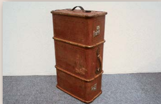
Reisekoffer Nr. / No. 222