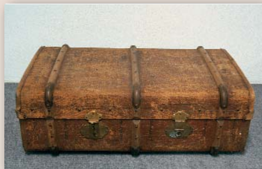
Reisekoffer Nr. / No. 224