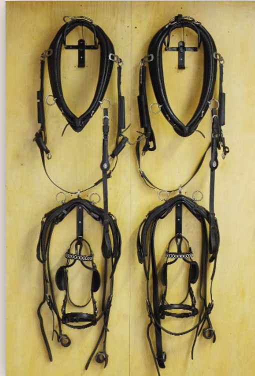
Zweispänner-Kummetgeschirr für Großpferde. Sehr schönes Geschirr für Einsteiger oder als Trainingsgeschirr.