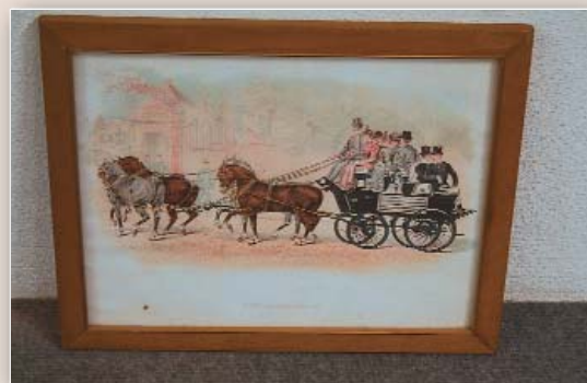
Maße Bild H 33 x B 40 cm