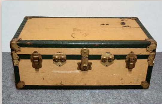
Höhe 35 cm, Breite 90 cm, Tiefe 50 cm