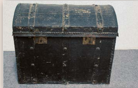
Höhe 60 cm, Breite 72 cm, Tiefe 47 cm