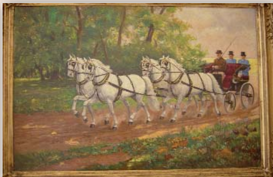
Maler J. Simandl, Maße ohne Rahmen H 48 x B 73 cm