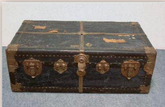
Reisekoffer Nr. / No. 223