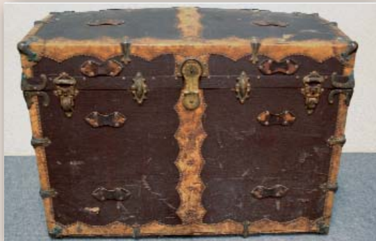
Höhe 70 cm, Breite 97 cm, Tiefe 66 cm