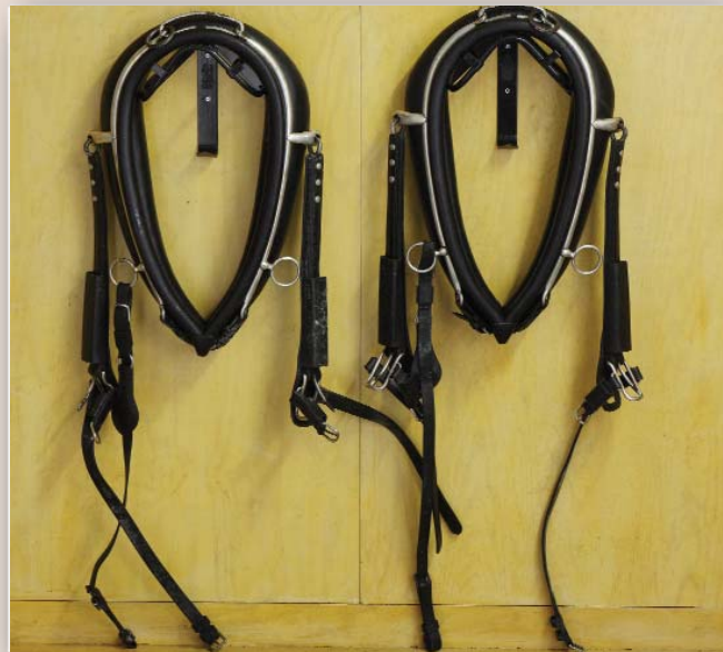
Zwei sehr gut erhaltene Coach-Kummete, komplett mit Strangstutzen.