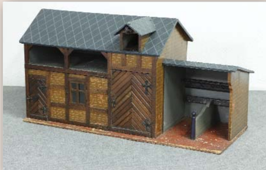
Pferdestall mit Nebengebäude aus dem Jahre ca. 1920