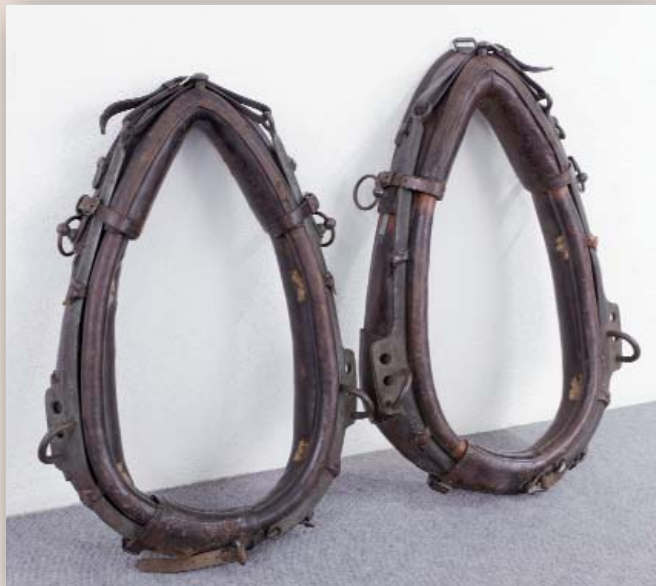
Diese super erhaltenen Kummete sind in der Größe verstellbar.