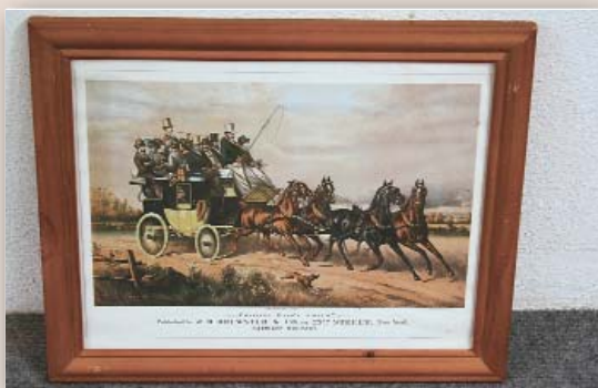
Publisher: J.B. Brewster & Co, NY, Maße Bild H 33 x B 40 cm