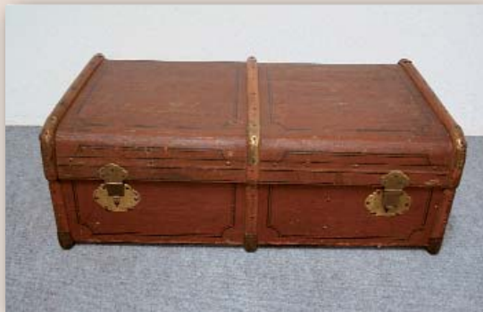
Reisekoffer Nr. / No. 221