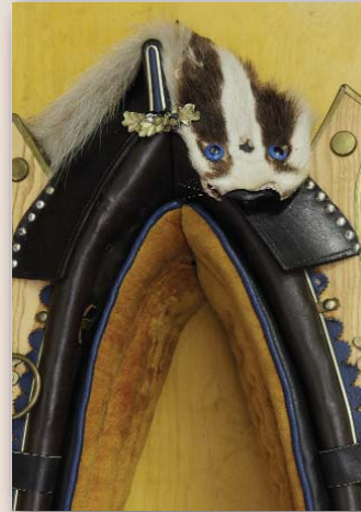
Zweispänner- Gala- Prunkgeschirr Nr. / No. 253

Dieses aufwändig gearbeitete Geschirr wurde ca. 1950 von einem bekannten österreichischen Sattlermeister hergestellt. Mit original Dachsfell.