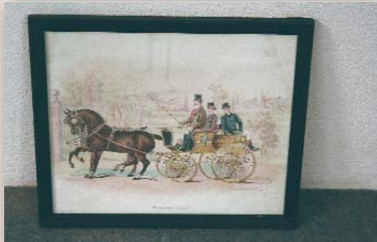
Maße Bild H 33 x B 40 cm