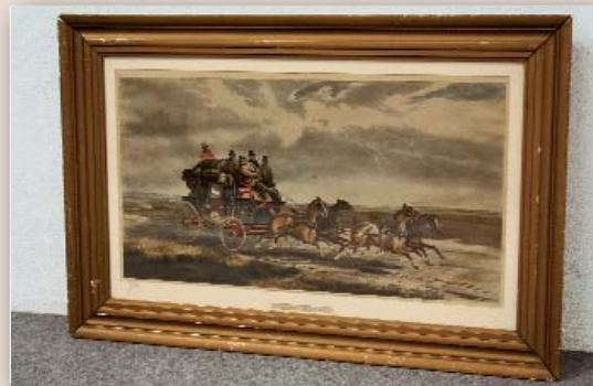
Maße mit Rahmen H 52,5 x B 78,5 cm, ohne Rahmen H 32 x B 60 cm